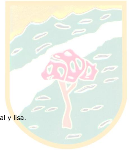
TABLAS DE FUNCIÓN

Correr lo más rápido posible la distancia de 1.000 metros.